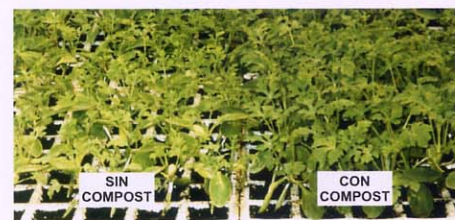
Cultivo de sandía en vivero hortícola.