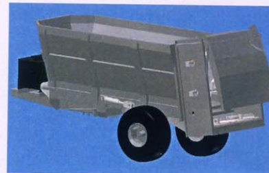
Diseño de apero distribuidor de compost

• Se están diseminando los resultados de forma extensa, concentrando los esfuerzos en el área de proyecto. Se ha creado en Andalucía una "Oficina LIFE del Compost" como canal de información sobre la tecnología del co-compostaje y la aplicación de los compost. Asimismo, se constituye el "Foro LIFE del Compost", donde se debaten los aspectos técnicos, económicos y ambientales.