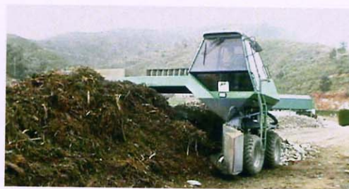
Volteo de pila de co-compostaje en planta de Residuos Sólidos Urbanos (Ayto. Mijas)