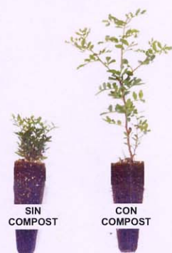
Cultivo de plantas de lentisco en vivero forestal.