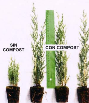
Cultivo de plantas de ciprés en vivero ornamental.