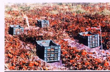
Cultivo de tomate.