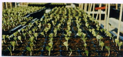
El compost de calidad obtenido se está usando como sustituto de tierra vegetal en jardinería y paisajismo, como enmienda orgánica en reforestaciones, cultivos forestales y agrícolas y como sustrato en viveros forestales, ornamentales y hortícolas.

Este material puede ser beneficiosamente aplicado al suelo como enmienda orgánica, así como sustrato en viveros. A pesar de ello actualmente está desprestigiado en ciertas zonas y hay que realizar un esfuerzo en difundir sus beneficios así como para evitar prácticas inadecuadas que deterioren la validez de estos productos orgánicos como fertilizantes.