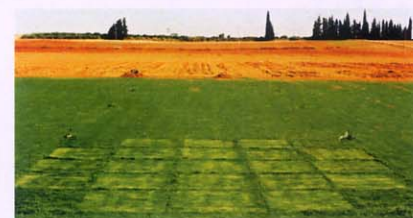
Plantación de césped en paisajismo.

Si está interesado en complementar o ampliar la información generada en el proyecto puede contactarnos en: