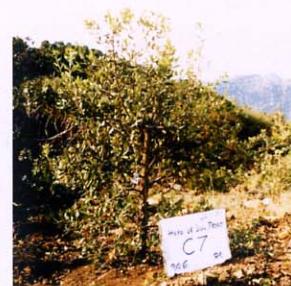
Parcela de reforestación con alcornoque.