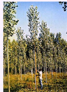
Cultivo forestal de chopo.