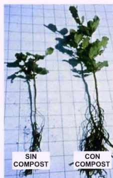
Cultivo de plantas de algarrobo en vivero forestal.